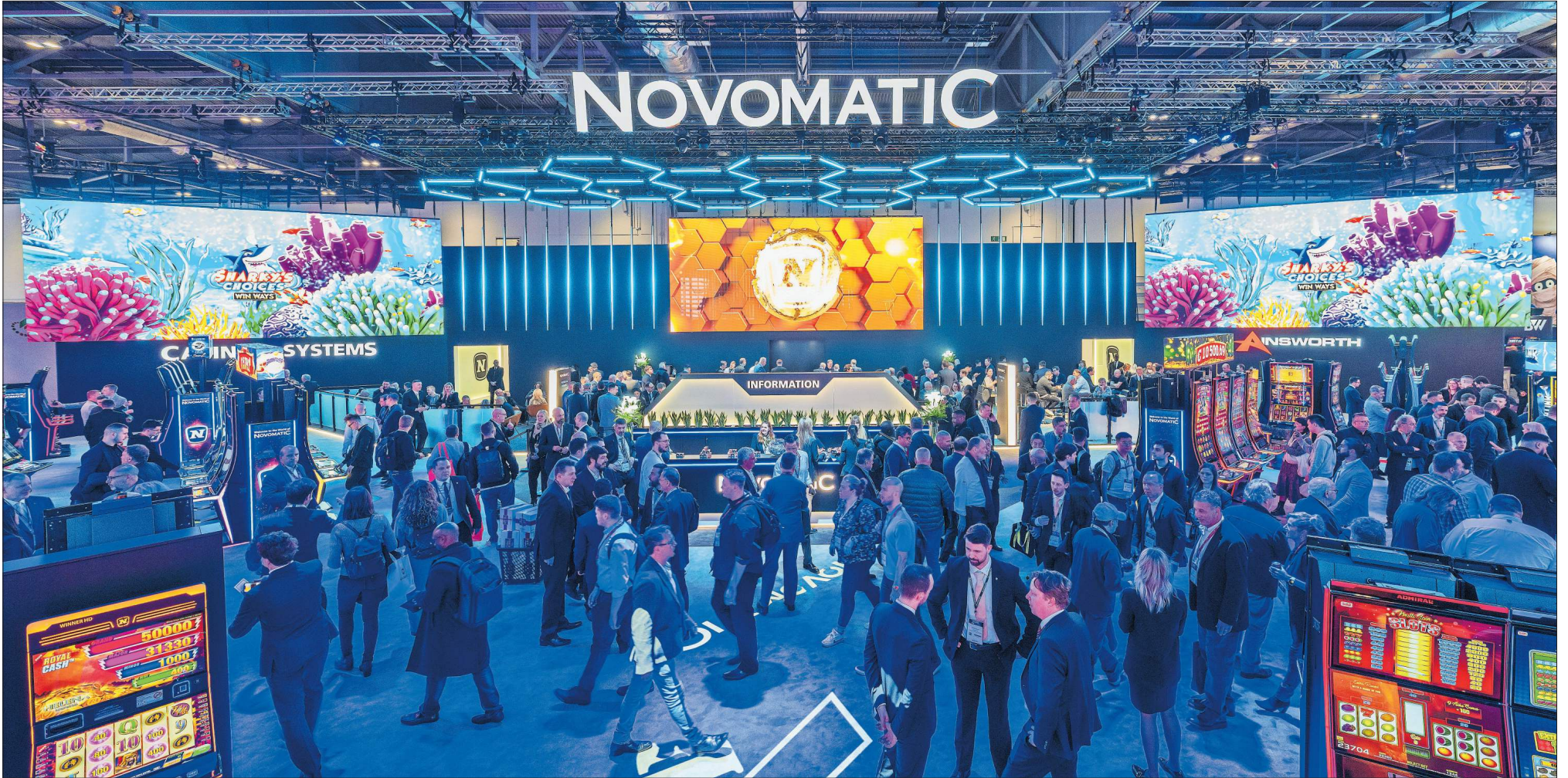
Regelmäßig stellt Novomatic auf den größten Branchenmessen der Welt seine neuesten Innovationen vor.

Weltkonzern aus Niederösterreich. Seit der Gründung im Jahr 1980 hat sich Novomatic als Europas führender Gaming-Technologiekonzern etabliert und ist heute weltweit in über 120 Ländern tätig. Das Unternehmen mit Hauptsitz in Gumpoldskirchen steht seit über 40 Jahren für Qualität und Innovation.