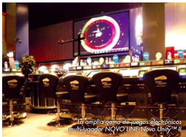
La amplia gama de juegos electrónicos multi-jugador NOVO LINE Novo Unity™ II.