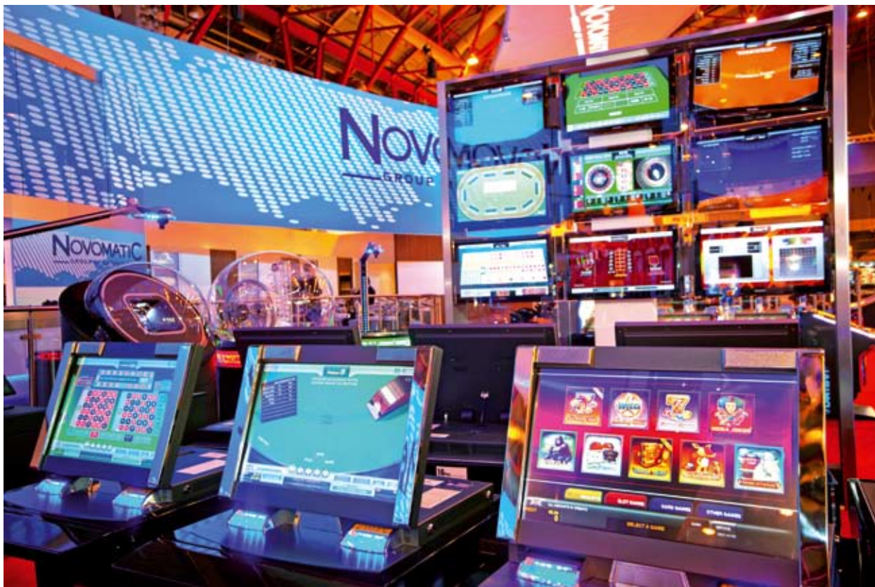
La amplia gama de juegos electrónicos multi-jugador NOVO LINE Novo Unity™ II.

Todos debemos emprender un período de instrucción e información a nuestros clientes acerca de la nueva ubicación y fecha: Es un proceso que para Novomatic se inicia en este mismo momento y nos acompañará a lo largo de todo el año; no sólo por la feria en sí sino también por la gran industria que representa." ■