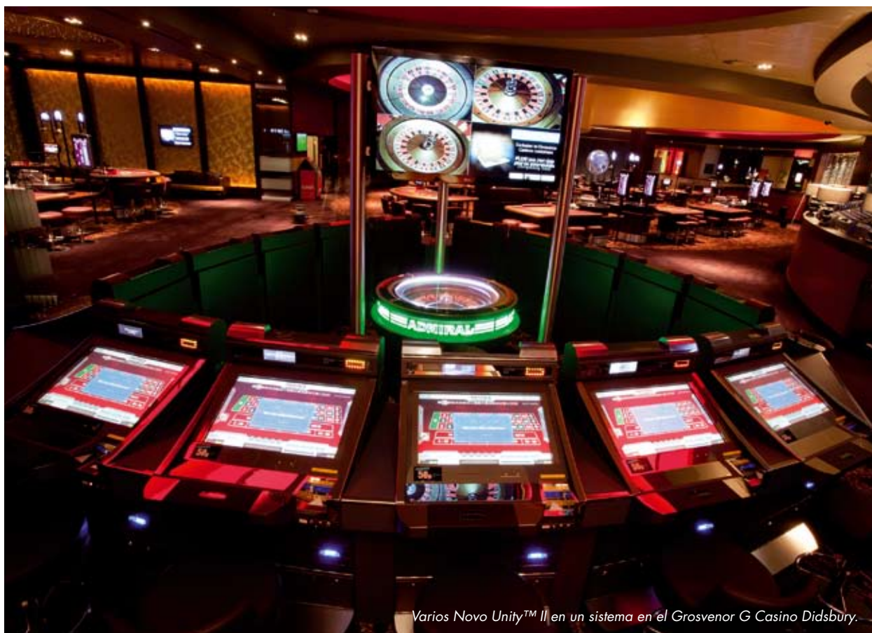
Varios Novo Unity™ II en un sistema en el Grosvenor G Casino Didsbury.

Muchas gracias por sus opiniones. Quisiéramos concluir con un gran 'gracias' por la confianza que Grosvenor continúa depositando en Novomatic y sin duda esperaremos con gran interés futuros informes de nuevos 'hitos' en la relación. ■