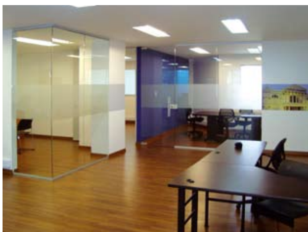
Espacio para la actividad comercial: modernas oficinas en Bogotá.