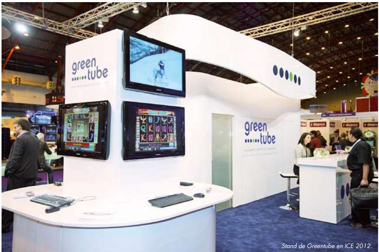
Stand de Greentube en ICE 2012.