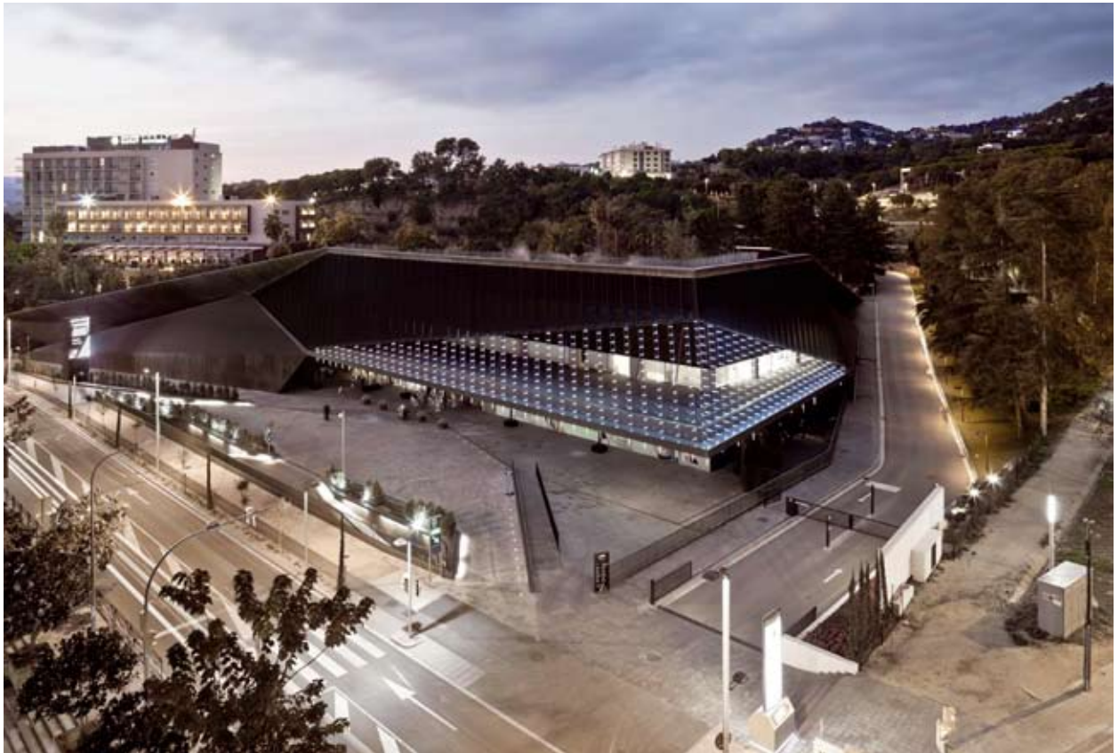
Gran Casino Costa Brava en Lloret de Mar.