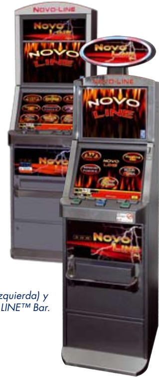
NOVO LINE™ Salon (izquierda) y NOVO LINE™ Bar.

Novomatic Gaming Spain también se ha convertido en un proveedor de gran éxito de equipos tipo C para los principales operadores españoles de casinos. La exhibición de los productos, por lo tanto, también dará a los visitantes una idea de la gran variedad de juegos electrónicos multi-jugador y soluciones NOVO LINE Novo Unity™ II con una presentación de gabinetes NOVOSTAR® SL1 Slant Top con Novo Flying Roulette™ y Novo Flying Black-Jack™, así como la combinación de videojuegos número 1 para NOVO LINE Novo Unity™ II. También dirigido al mercado de los casinos españoles está un banco de cinco máquinas Super-V+ Gaminator® con las últimas combinaciones, y también un jackpot Flexi-Link. ■