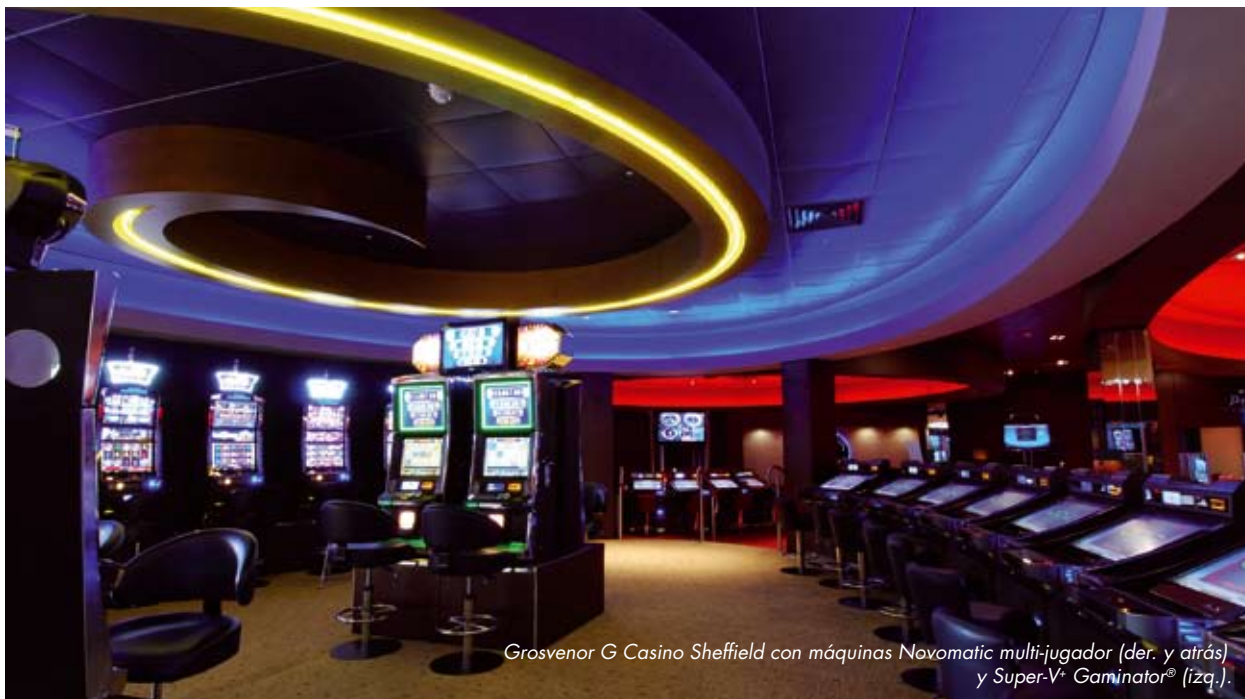
Grosvenor G Casino Sheffield con máquinas Novomatic multi-jugador (der. y atrás) y Super-V* Gaminator® (izq.).