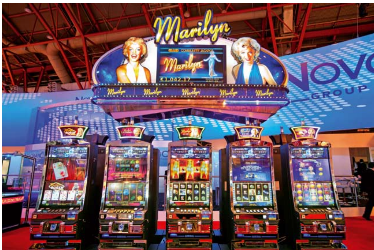
Gabinets Super-V* Gaminator® III con juegos protagonizados por Marilyn juegos individuales Coolfire™ con el temático MARILYN JACKPOT™.

Rutilante glamour y recuerdos brillantes de la inolvidable rubia de Hollywood montan la escena (asistida en ICE por un equipo de personas caracterizado como Marilyn).