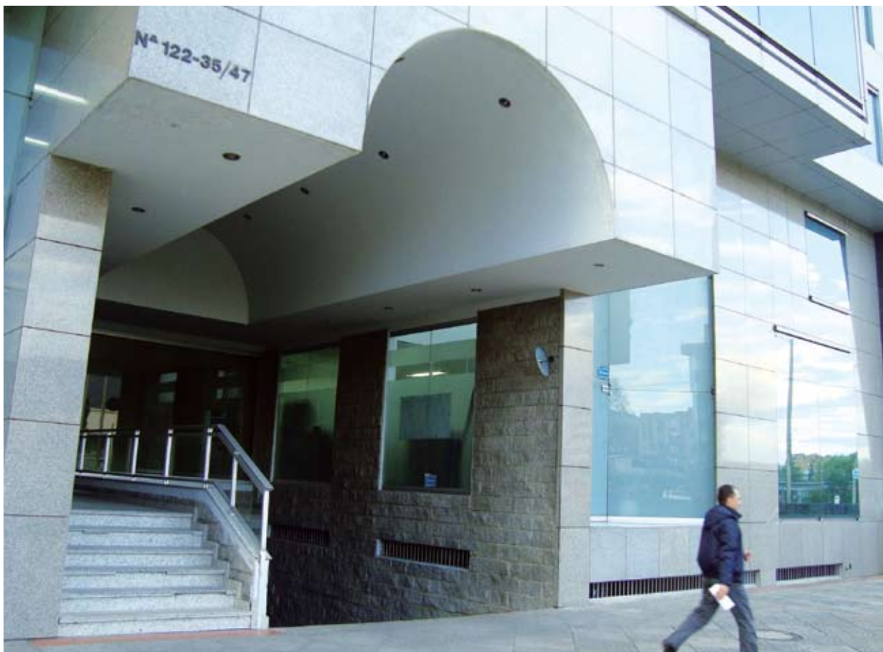
La nueva casa de AGI Gaming Colombia S.A.S. en Bogotá.