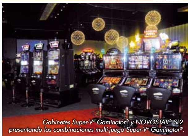
Gabinetes Super-V+ Gaminator® y NOVOSTAR® SL2 presentando las combinaciones multi-juego Super-V+ Gaminator®.