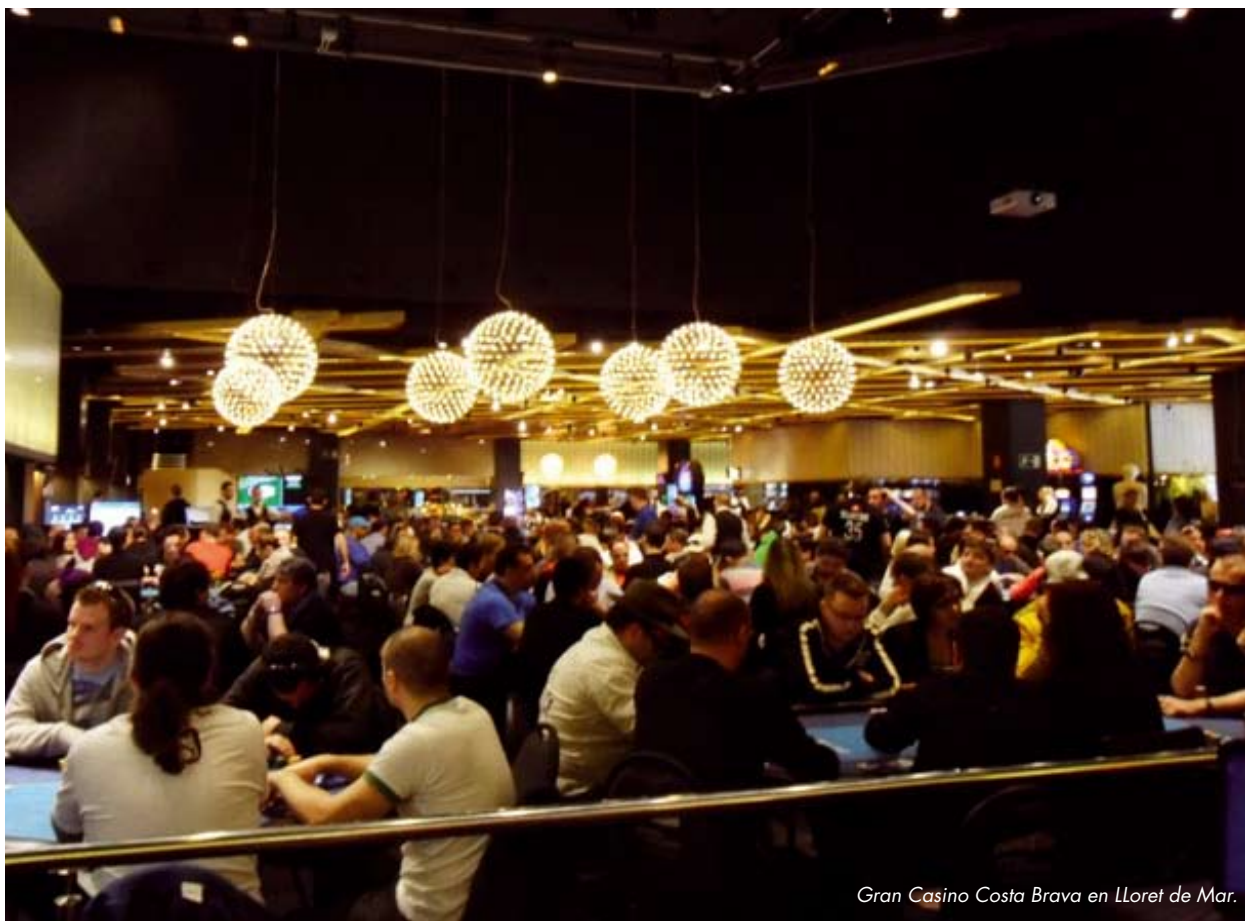
Gran Casino Costa Brava en Lloret de Mar.