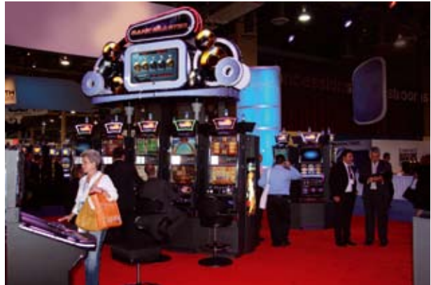
El stand Novomatic en G2E, Las Vegas.

Ferias del juego de azar en USA con la participación de Reel Games.