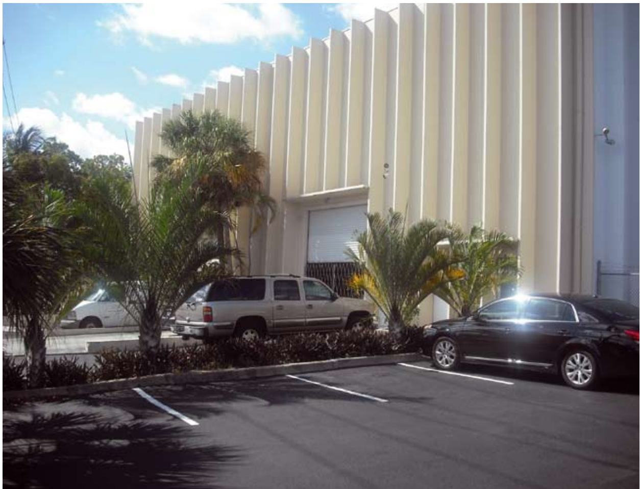
Sede principal de Reel Games Inc. en Fort Lauderdale, Florida.