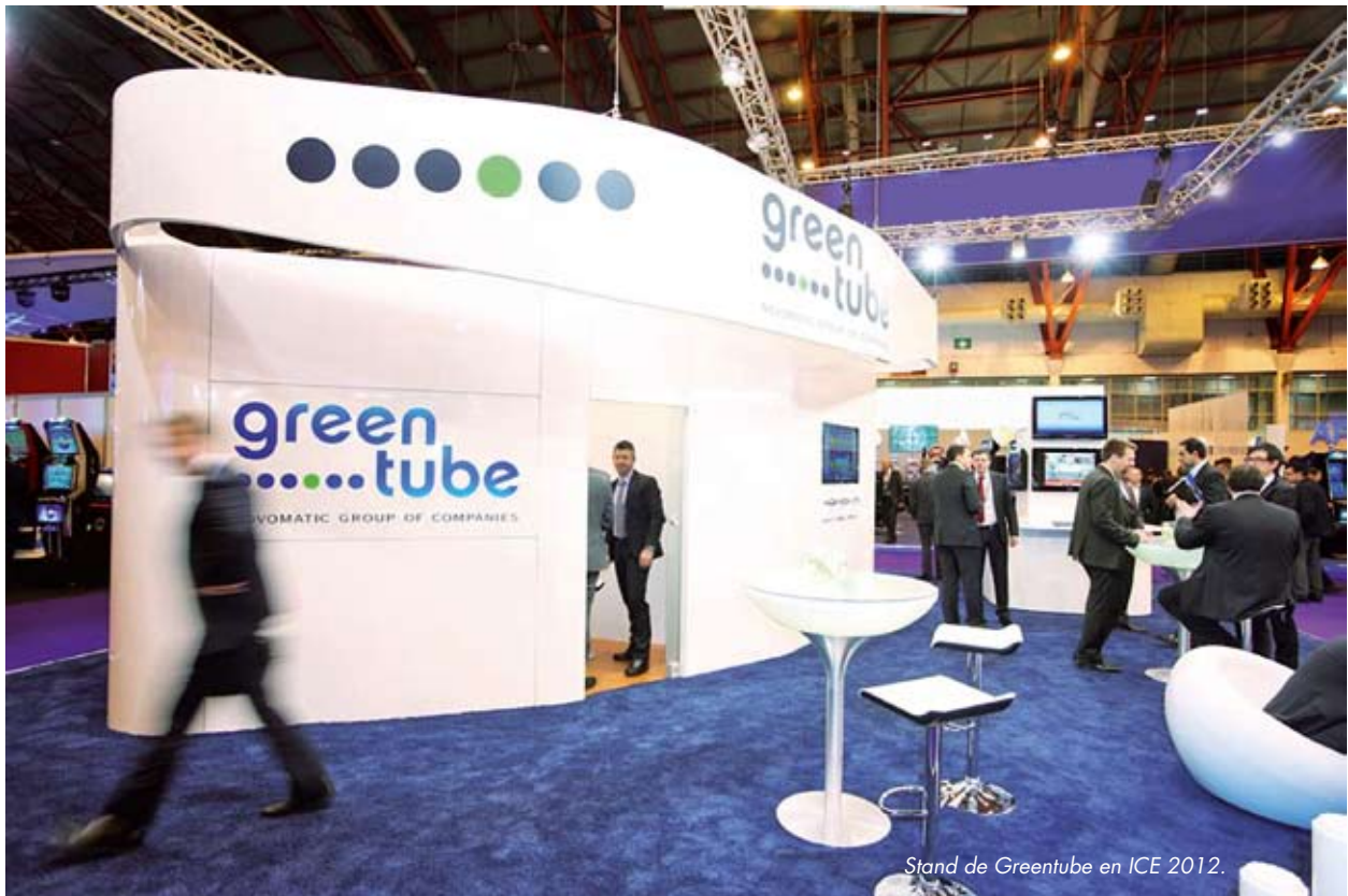
Stand de Greentube en ICE 2012.