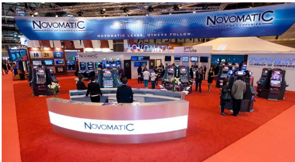
Stand de Novomatic en Fer Interazar 2011.