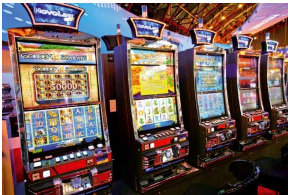
El gabinete NOVO LINE™ INTERACTIVE.

Dos diseños idénticos de apuesta ofrecen las opciones tradicionales de apuesta para cada anillo de números, como a su vez las apuestas únicas Double Action™ realizadas sobre resultados compuestos. Los jugadores pueden elegir apostar a un sólo número, por docena, columna, 7 (un solo cero) u 8 (doble cero) o dos números idénticos cualquiera - con enormes posibilidades de hasta 1.200:1! El concepto Double Action™ ofrece más emoción y oportunidades muy atractivas ya sea en su versión tradicional de ruleta en vivo, TouchBet® o virtual, Novo Flying Double Action Roulette™.