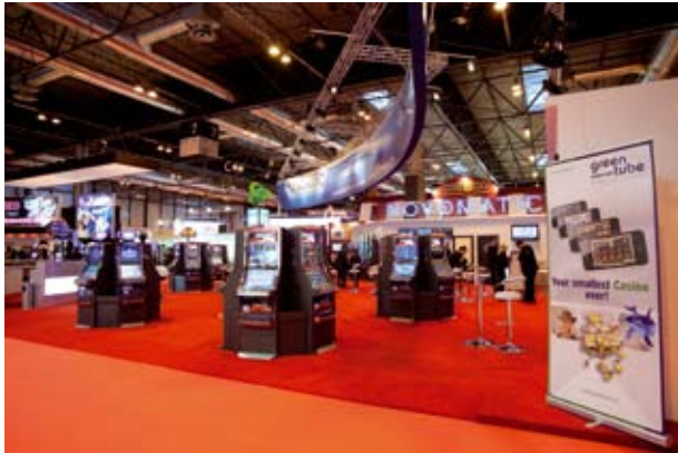
El stand de Novomatic en Fer Interazar 2011.