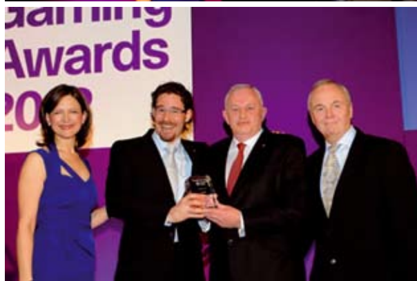
Austrian Gaming Industries recibiendo dos importantes premios en la ceremonia inaugural de Totally Gaming Awards.